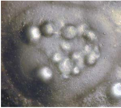
Figuur 3 Migratie van de nucleus naar de periferie.