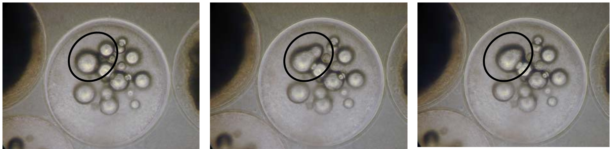
Figuur 2 Fusie van vetdruppels.

8 Typen oocyten, gevonden in elkaar opvolgende biopsies, zijn gekarakteriseerd op basis van 6 parameters: transparantie, diameter en het aantal vetdruppels (Figuur 2), positie en visibiliteit van de nucleus (Figuur 3), en diameter van de oocyte. Aangezien ontwikkeling werd getoond door opvolging van typen is er sprake van ontwikkelingsstadia (Figuur 4).